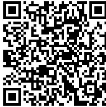
三色蓝牙桌牌03款 产品手册下载 (800*480)

本指南会指引您顺利安装手机操作程序，安装程序前请先阅读本使用指南，并保存备用。安装程序请扫描以上 APP 下载二维码获取，APP 详细操作步骤和云端服务器操作步骤请扫描上端电子版说明书二维码查看。操作时请您对照说明书详细步骤，仔细学习各操作模块的功能。